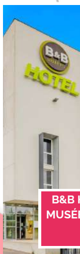
B&B HOTEL LENS MUSÉE DU LOUVRE