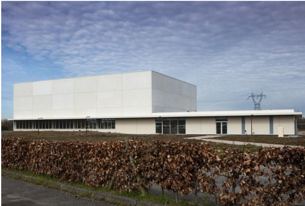
Salle des sports de Genech